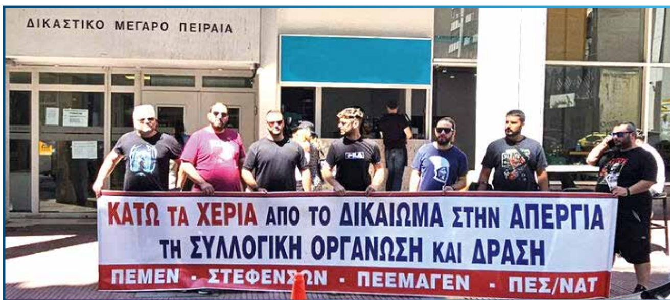
Παράσταση διαμαρτυρίας στο Δικαστήριο του Πειραιά για τον αγώνα των Ναυτεργατών του ΕΛΚΕΘΕ

Ένας αγώνας πρωτόγνωρος για τους ναυτεργάτες που κρινόταν καθημερινά. Ένας αγώνας δύσκολος