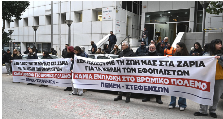
είναι στο πλευρό σας - αυτό είναι το κοινό μήνυμα προς τους ναυτικούς από ναυτικά συνδικάτα και εργοδότες από όλο τον κόσμο).

Αυτές είναι οι συνέπειες της εμπλοκής στον πόλεμο για να διεκδικεί η ελληνική αστική τάξη μερτικό από τη λεία των ληστών.