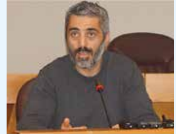
"Ο ναυτεργάτης δεν μπορεί να είναι παράπλευρη απώλεια" alithia.gr

Επανάλαβε την θέση της ΠΕΜΕΝ, να χαρακτηριστούν εμπόλεμες ζώνες οι περιοχές που μαίνονται ιμπεριαλιστικοί πόλεμοι και άμεσο επαναπατρισμό των ναυτεργατών που διέρχονται από εμπόλεμες θαλάσσιες περιοχές, χωρίς καμία επιβάρυνση των εξόδων παλιννόστησης. Μεταξύ άλλων αναφέρθηκε στις εξελίξεις στη ναυτική εκπαίδευση και επισήμανε τη διαρκή υποβάθμισή της από όλες τις μέχρι σήμερα κυβερνήσεις. Επισήμανε την κατάσταση που επικρατεί στην Ακτοπλοΐα και την εντατικοποίηση της δουλειάς, με ελλιπής μέτρα ασφάλειας και υγείας για τους ναυτεργάτες. Την ανάγκη για ανανέωση και εφαρμογή ΣΣΕ που να ανταποκρίνονται στις πραγματικές ανάγκες των ναυτεργατών, σε όλες τις κατηγορίες πλοίων και επιπλέον ανέφερε τις συνθήκες υποστελέχωσης και εγκατάλειψης που επικρατούν στις υπηρεσίες του υπουργείου Ναυτιλίας, Οίκο Ναύτη, ΥΝΜ, κά.