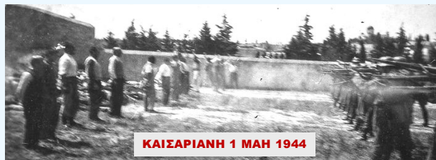
ΚΑΙΣΑΡΙΑΝΗ 1 ΜΑΗ 1944

Πανελληνίας Ένωσης Συνταξιούχων ΝΑΤ (ΠΕΣ-ΝΑΤ)