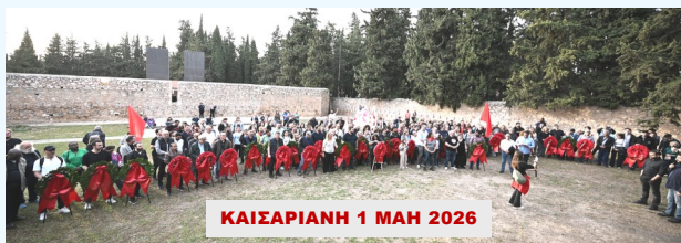
ΚΑΙΣΑΡΙΑΝΗ 1 ΜΑΗ 2026

Σε κλίμα συγκίνησης, μαχητικότητας και αγωνιστικής ανάτασης πραγματοποιήθηκε η κατάθεση στεφάνων στο Σκοπευτήριο της Καισαριανής από συνδικάτα και μαζικούς φορείς, τιμώντας τους 200 ήρωες κομμουνιστές που εκτελέστηκαν την Πρωτομαγιά του 1944, τους 200 που περπάτησαν προς τον θάνατο με το κεφάλι ψηλά.